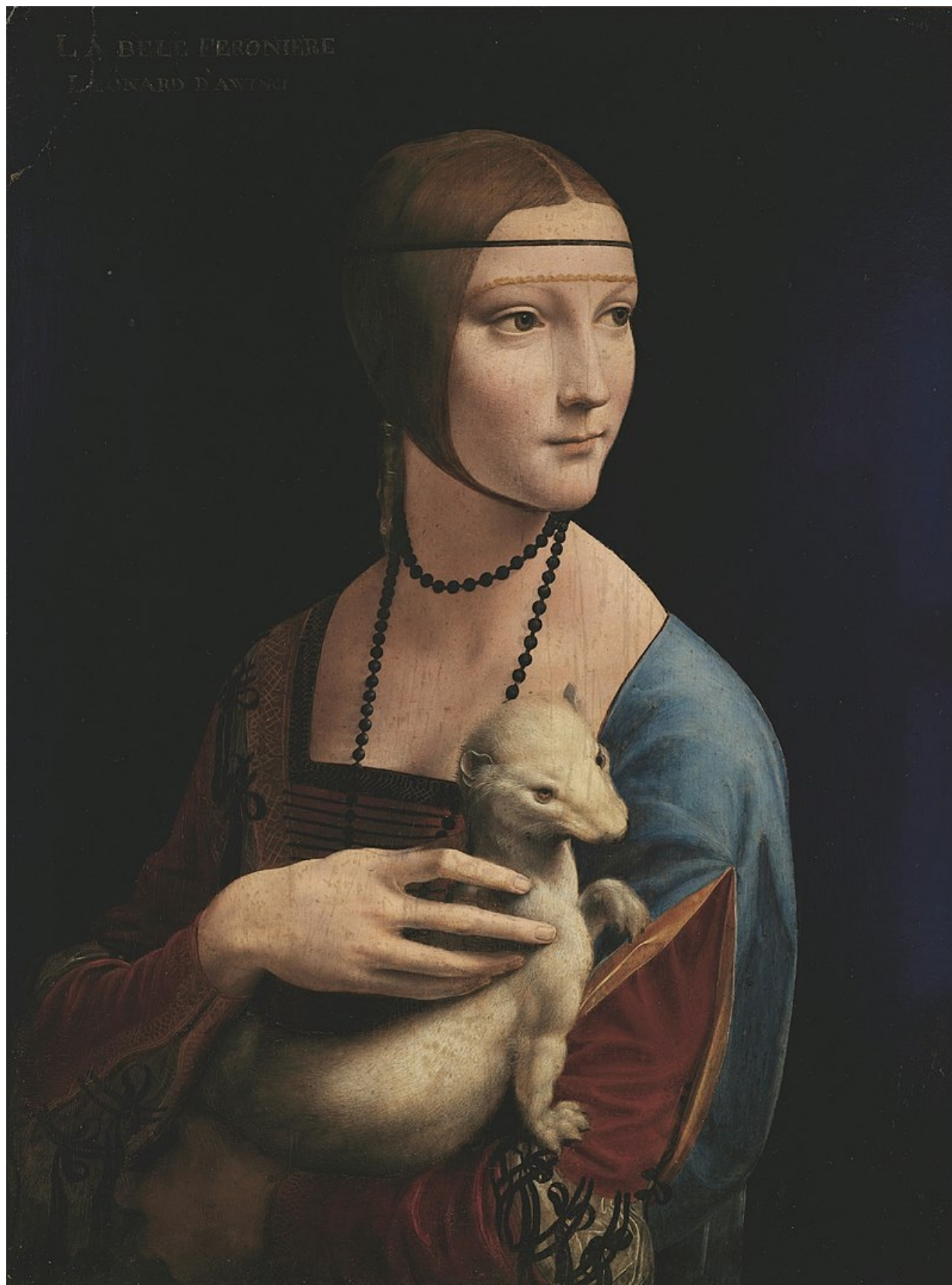
Cecilia è la famosa "Dama con l'ermellino" ritratta da Leonardo da Vinci nel 1489, durante la sua permanenza a Milano presso la corte di Ludovico Sforza detto il "Moro", ed ora conservato presso il museo di Czartoryski di Cracovia in Polonia, che l'ha regolarmente acquistato.

La rocca è circondata a Nord e ad Ovest da uno splendido parco di dieci ettari in stile Romantico, nel quale sono dislocati otto padiglioni tematici, mentre sul fronte meridionale è posto un bel giardino all'italiana.